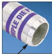
Corona Relief Taper