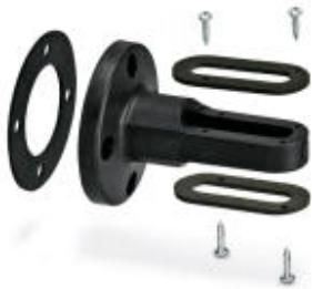
Angle for two-sided floor mounting, concealed cable routing, black

Please be informed that the data shown in this PDF Document is generated from our Online Catalog. Please find the complete data in the user's documentation. Our General Terms of Use for Downloads are valid ( http://phoenixcontact.com/download )