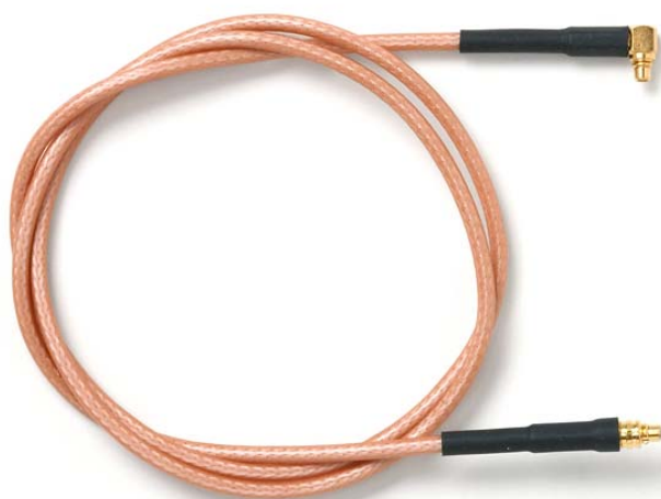
Model 73064 MMCX Plug to Right-Angle MMCX Plug, RG316/U

Snap-on coupling and micro-miniature size for fast connect and disconnect where space is limited