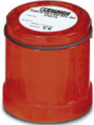
LED random flashing beacon element, 24 V DC, red

Please be informed that the data shown in this PDF Document is generated from our Online Catalog. Please find the complete data in the user's documentation. Our General Terms of Use for Downloads are valid ( http://phoenixcontact.com/download )