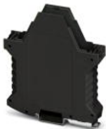
Component housing, color: black

Please be informed that the data shown in this PDF Document is generated from our Online Catalog. Please find the complete data in the user's documentation. Our General Terms of Use for Downloads are valid ( http://phoenixcontact.com/download )