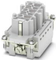
HEAVYCON socket insert, for 830 V (III/3), with 3 N/O contacts and 2 switch contacts, crimp connection

Please be informed that the data shown in this PDF Document is generated from our Online Catalog. Please find the complete data in the user's documentation. Our General Terms of Use for Downloads are valid ( http://phoenixcontact.com/download )