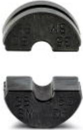
The figure shows the ...R35-50/DIE version

pre-round die (pair), for CRIMPFOX-C50, for sector cable 50 + 70 mm 2