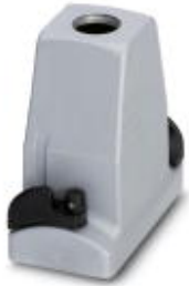
HEAVYCON ADVANCE EMV sleeve housing B10, with bayonet locking, height 100 mm, with 1x M32 thread, straight cable outlet

Please be informed that the data shown in this PDF Document is generated from our Online Catalog. Please find the complete data in the user's documentation. Our General Terms of Use for Downloads are valid ( http://download.phoenixcontact.com )