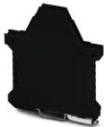
Component housing, length: 99 mm, Lower part, color: black, width: 12.5 mm, height: 114.5 mm

Please be informed that the data shown in this PDF Document is generated from our Online Catalog. Please find the complete data in the user's documentation. Our General Terms of Use for Downloads are valid ( http://phoenixcontact.com/download )