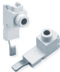
Type/Cat. No: P50UT Description: Power Feed Lug