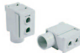
Type/Cat. No: P50UB Description: Modular Direct Power Feed