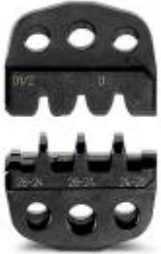
Spare die for CRIMPFOX-DSUB 5

Please be informed that the data shown in this PDF Document is generated from our Online Catalog. Please find the complete data in the user's documentation. Our General Terms of Use for Downloads are valid ( http://download.phoenixcontact.com )