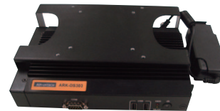
ARK-DS303 with standard mounting bracket