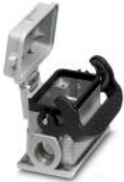
HEAVYCON box mounting base B10, with double locking latch, height 52 mm, with supports 2xM25 and protective cover

Please be informed that the data shown in this PDF Document is generated from our Online Catalog. Please find the complete data in the user's documentation. Our General Terms of Use for Downloads are valid ( http://download.phoenixcontact.com )