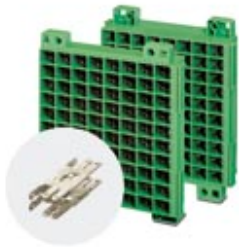
Connection honeycomb, Connection type: Screw mounting, Number of positions: 80, Color: green

Please be informed that the data shown in this PDF Document is generated from our Online Catalog. Please find the complete data in the user's documentation. Our General Terms of Use for Downloads are valid ( http://download.phoenixcontact.com )