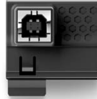
USB interface - Black