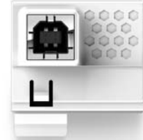
USB interface - White