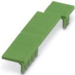
Terminal cover, 1 strip covers up to 12 terminal points, for ME-BUS terminal opening, (male side)

Please be informed that the data shown in this PDF Document is generated from our Online Catalog. Please find the complete data in the user's documentation. Our General Terms of Use for Downloads are valid ( http://phoenixcontact.com/download )