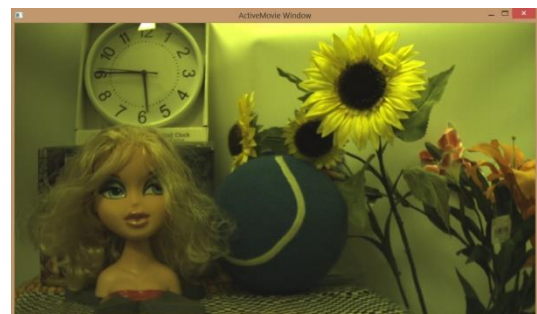
Camera Tool view mode