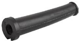
4804.0001 Sleeve black, 5.6 mm