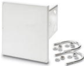
Flat panel antenna, 5 GHz, gain 18 dBi, connection N (female), IP55

Please be informed that the data shown in this PDF Document is generated from our Online Catalog. Please find the complete data in the user's documentation. Our General Terms of Use for Downloads are valid ( http://download.phoenixcontact.com )