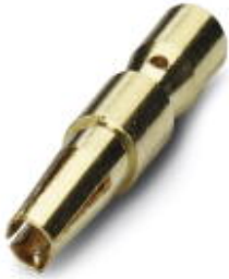
Crimp contact, turned, contact diameter: 1.5 mm, crimp range: 0.08 mm 2 ... 0.22 mm 2

Please be informed that the data shown in this PDF Document is generated from our Online Catalog. Please find the complete data in the user's documentation. Our General Terms of Use for Downloads are valid ( http://phoenixcontact.com/download )