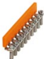
Fixed bridge, Number of positions: 10, Color: silver

Please be informed that the data shown in this PDF Document is generated from our Online Catalog. Please find the complete data in the user's documentation. Our General Terms of Use for Downloads are valid ( http://download.phoenixcontact.com )