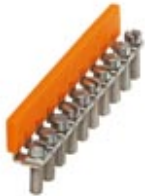
Fixed bridge, Number of positions: 10, Color: silver

Please be informed that the data shown in this PDF Document is generated from our Online Catalog. Please find the complete data in the user's documentation. Our General Terms of Use for Downloads are valid ( http://download.phoenixcontact.com )