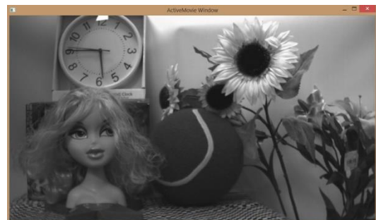
Camera Tool view mode