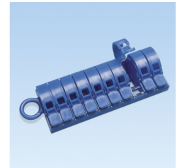
PM D EMPTY DISPENSER