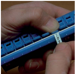
Dispenser filled with one roll each legend 0 thru 9.