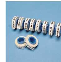
PM D R - * - *