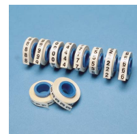
PMDR - * - *