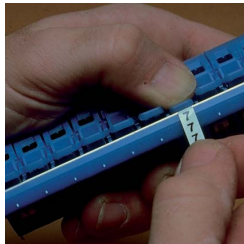
Dispenser filled with one roll each legend 0 thru 9.