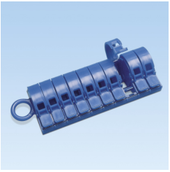
PMD EMPTY DISPENSER