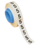
PMDR - *