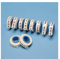
PMDR - * - *