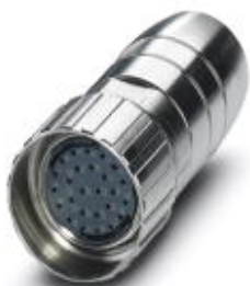
Cable connector, straight, Screw locking, M27, number of positions: 26, type of contact: Socket, Solder connection, shielded: yes

Please be informed that the data shown in this PDF Document is generated from our Online Catalog. Please find the complete data in the user's documentation. Our General Terms of Use for Downloads are valid ( http://phoenixcontact.com/download )