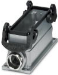
Box mounting base, with double locking latch, height 67 mm, with screw connection, 1x M25

Please be informed that the data shown in this PDF Document is generated from our Online Catalog. Please find the complete data in the user's documentation. Our General Terms of Use for Downloads are valid ( http://phoenixcontact.com/download )