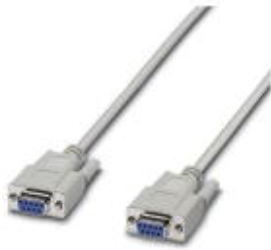
RS-232 cable, 9-pos. D-SUB female connector on 9-pos. D-SUB female connector, 9-wire, 1:1

Please be informed that the data shown in this PDF Document is generated from our Online Catalog. Please find the complete data in the user's documentation. Our General Terms of Use for Downloads are valid ( http://download.phoenixcontact.com )