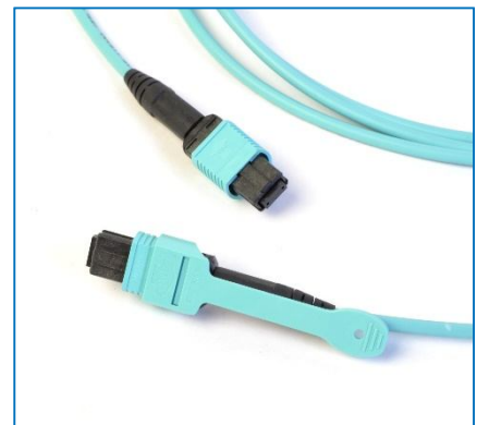
MPO Pull Tab