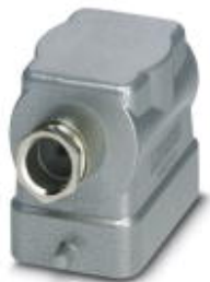
HEAVYCON B6 sleeve housing, for single locking latch, height: 56 mm, with 1 x Pg13.5 screw connection, lateral cable outlet

Please be informed that the data shown in this PDF Document is generated from our Online Catalog. Please find the complete data in the user's documentation. Our General Terms of Use for Downloads are valid ( http://phoenixcontact.com/download )