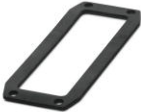
Ersatz-Flachdichtung, für HEAVYCON-EVO-Anbaugeschäfte der Bauform B24

Please be informed that the data shown in this PDF Document is generated from our Online Catalog. Please find the complete data in the user's documentation. Our General Terms of Use for Downloads are valid ( http://phoenixcontact.com/download )