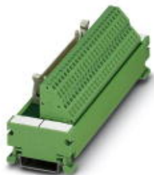
VARIOFACE module, with spring-cage connection and flat-ribbon cable connector, for mounting on NS 35/7.5, 14-pos.

Please be informed that the data shown in this PDF Document is generated from our Online Catalog. Please find the complete data in the user's documentation. Our General Terms of Use for Downloads are valid ( http://phoenixcontact.com/download )