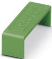
Lock, prevents MSTB plug being pulled out unintentionally, color: l green

Please be informed that the data shown in this PDF Document is generated from our Online Catalog. Please find the complete data in the user's documentation. Our General Terms of Use for Downloads are valid ( http://phoenixcontact.com/download )