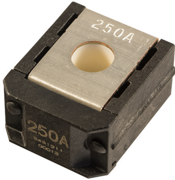
ZCASE Single Mega/Starter Fuse