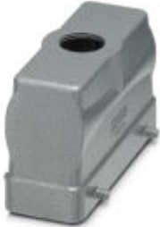
HEAVYCON B24 sleeve housing, for double locking latch, height: 65 mm, with 1 x M25 thread, straight cable outlet

Please be informed that the data shown in this PDF Document is generated from our Online Catalog. Please find the complete data in the user's documentation. Our General Terms of Use for Downloads are valid ( http://phoenixcontact.com/download )