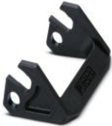
Replacement single locking latch for HEAVYCON EVO housing type B10, PA

Please be informed that the data shown in this PDF Document is generated from our Online Catalog. Please find the complete data in the user's documentation. Our General Terms of Use for Downloads are valid ( http://phoenixcontact.com/download )