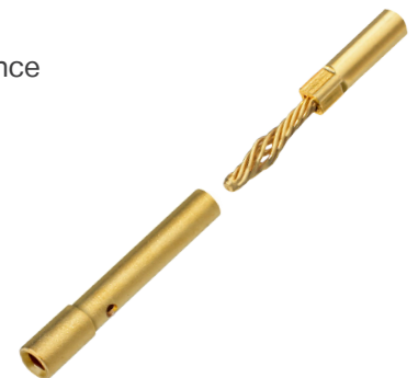
Detail of Dura-Con™ Twist Pin