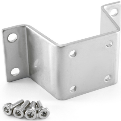
Bracket, with 4 pcs of M3 A2 screws

Wall bracket used with Low Pim Power Splitters in 2 Way, 3 Way and 4 Way models.