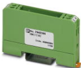
Custom circuit module, consisting of housing, MKDS 3 connection terminal blocks and PCB

Please be informed that the data shown in this PDF Document is generated from our Online Catalog. Please find the complete data in the user's documentation. Our General Terms of Use for Downloads are valid ( http://phoenixcontact.com/download )