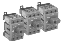
CDNF16 CDF25 CDF32