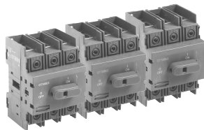
CDNF30 CDF60 CDF100