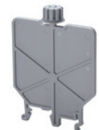
Mounting Accessories for CTSPC