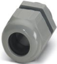
Cable gland, Cable gland material: Polyamide, External cable diameter 5 mm ... 10 mm, Shielding: No, Connecting thread: Pg11, Color: silver grey

Please be informed that the data shown in this PDF Document is generated from our Online Catalog. Please find the complete data in the user's documentation. Our General Terms of Use for Downloads are valid ( http://phoenixcontact.com/download )