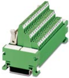
VARIOFACE module, with screw connection and flat-ribbon cable connector, for assembly on NS 35/7.5, 64 positions

Please be informed that the data shown in this PDF Document is generated from our Online Catalog. Please find the complete data in the user's documentation. Our General Terms of Use for Downloads are valid ( http://phoenixcontact.com/download )