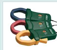
Model PQ3120 1000A Current Clamp Probes with 2.2" (55mm) jaw opening

1200A (12"/304mm) or 3000A (24"/609mm) Flexible Current Clamp Probes for wrapping around busbars