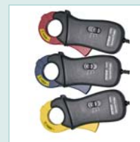
Model PQ3110 100A Current Clamp Probes with 1.2" (30mm) jaw size