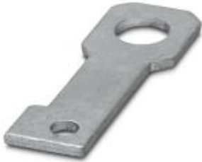
Plate for fixing the FLT-ISG-100-EX isolating spark gap to a flange, drill hole diameter of 22 mm.

Please be informed that the data shown in this PDF Document is generated from our Online Catalog. Please find the complete data in the user's documentation. Our General Terms of Use for Downloads are valid ( http://phoenixcontact.com/download )