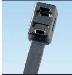
PLB2S/3S/4S Head Design