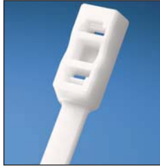
PLB4H Head Design